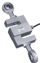
Rotules - Rod end ball joints